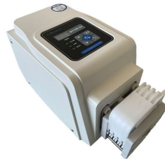
Schlauchpumpe zur Läpp- und Poliermittelversorgung