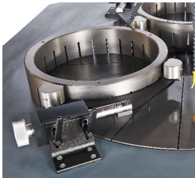
Haltearm mit Abrichtring